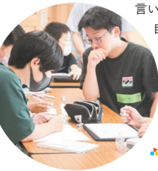
取材・文 松岡颯斗

子どもたちには、もっと学年を超えた友達や地域の大人たちと関わってほしいと願っています。そのためにはもっと町内の方々に、寺子屋の活動を理解してもらえるように努力が必要です。また資金調達にも苦労しますが、助成金などを利用しながら運営をしています。名取さんは、「活動を義務感でやったら楽しくない。自身の持っている熱量を傾けられることをやっていだけだよ」とビジネスプロジェクトアワードの時、審査員からアドバイスしてもらった言葉が心に残っているといます。だから「子どもたちに寺子屋という場所が必要とされ、自分の熱意と気力が続く限り、細く長く楽しく活動を続けたい」。やりがいや問われると「兼ねてからの想いが形になり、たくさんのスタッフや、子どもたち・保護者・地域の方に理解いただいている。本当にありがたいことです」と語り、今後は地元の高校生や大学生も巻き込んで一緒に楽しく活動をしていきたいと思いを膨らませています。