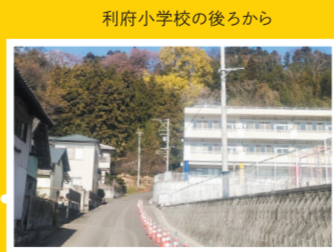
利府小学校の後ろから